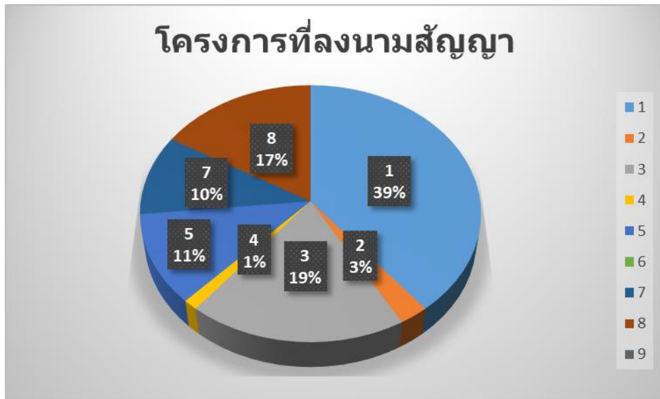
แผนภูมิที่ ๓ จำนวนโครงการลงนามสัญญาตามยุทธศาสตร์การพัฒนา