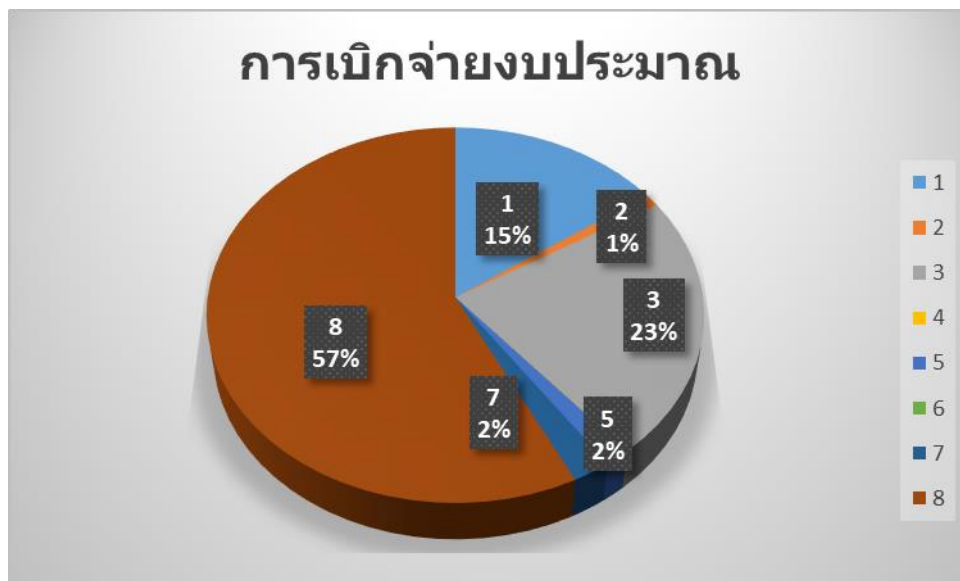
แผนภูมิที่ ๔ จำนวนการเบิกจ่ายงบประมาณโครงการตามยุทธศาสตร์การพัฒนา