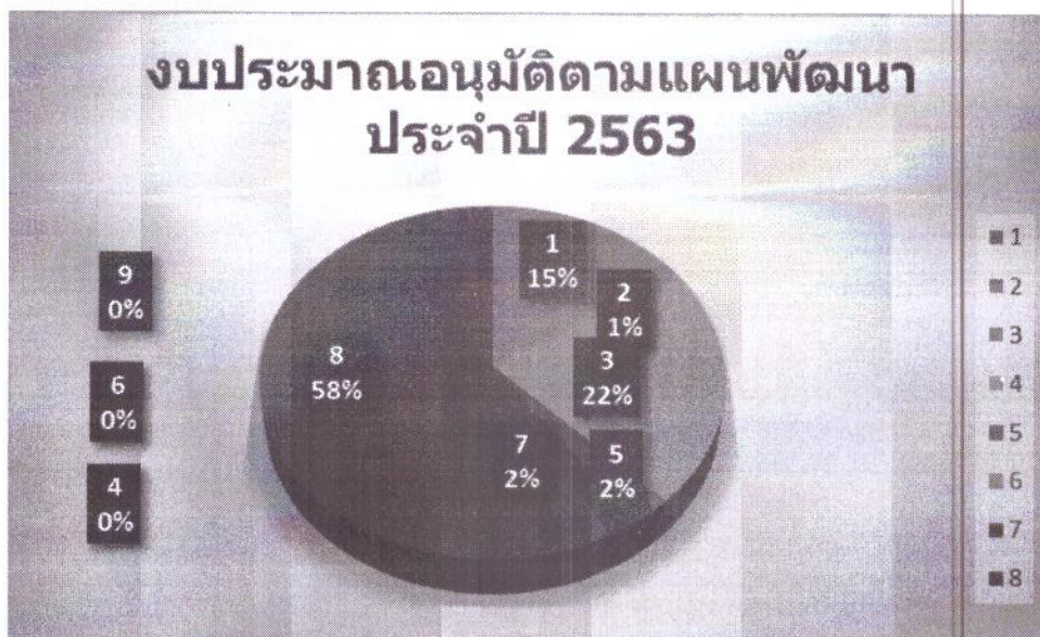
แผนภูมิที่ ๒ จำนวนงบประมาณโครงการที่อนุมัติดำเนินการตามยุทธศาสตร์การพัฒนา