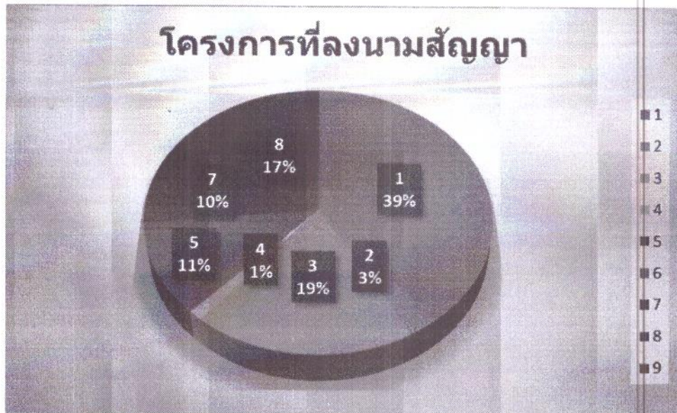
แผนภูมิที่ ๓ จำนวนโครงการลงนามสัญญาตามยุทธศาสตร์การพัฒนา