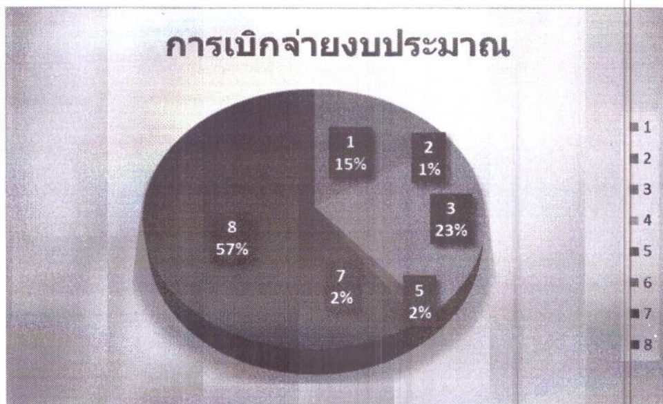
แผนภูมิที่ ๔ จำนวนการเบิกจ่ายงบประมาณโครงการตามยุทธศาสตร์การพัฒนา